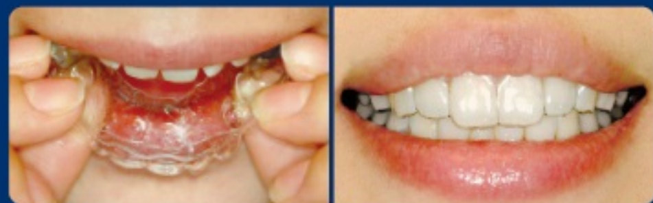
アライナーの着脱と装着したところ

アライナーが長時間、歯を覆うため歯に食べかす等が残っているとむし歯になるリスクが高まります。装置を使用する前は、特に口の中のクリーニングを心がけましょう。